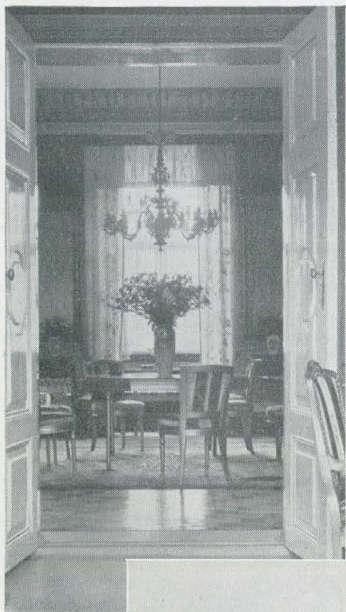
Kig ind i Marmorsalen